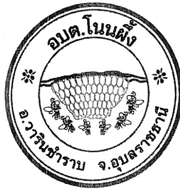
องค์การบริหารส่วนตำบลโนนผึ้ง

องค์การบริหารส่วนตำบลโนนผึ้ง หวังเป็นอย่างยิ่งว่าแผนพัฒนาท้องถิ่น (พ.ศ.๒๕๖๑-๒๕๖๕) เพิ่มเติม ครั้งที่ ๓ ฉบับนี้ จะได้ใช้เป็นแนวทางการจัดทำงบประมาณประจำปีและตอบสนองความต้องการของประชาชนในเขต องค์การบริหารส่วนตำบลโนนผึ้ง อย่างมีประสิทธิภาพต่อไป