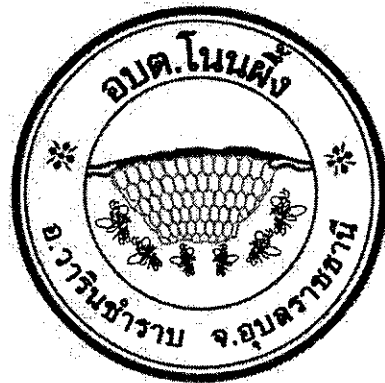
องค์การบริหารส่วนตำบลโนนผึ้ง

องค์การบริหารส่วนตำบลโนนผึ้ง หวังเป็นอย่างยิ่งว่าแผนพัฒนาท้องถิ่น (พ.ศ. ๒๕๖๑-๒๕๖๕) ฉบับนี้ จะได้ใช้เป็นแนวทางการจัดทำงบประมาณประจำปีและตอบสนองความต้องการของประชาชนในเขตองค์การบริหาร ส่วนตำบลโนนผึ้ง อย่างมีประสิทธิภาพต่อไป